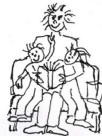
Sich geborgen fühlen