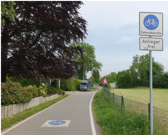
Weyhe, Am Deich