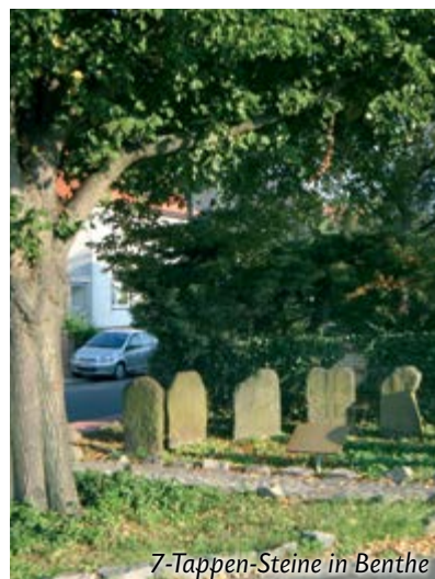
7-Tappen-Steine in Benth